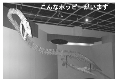
こんなホッピーがいます