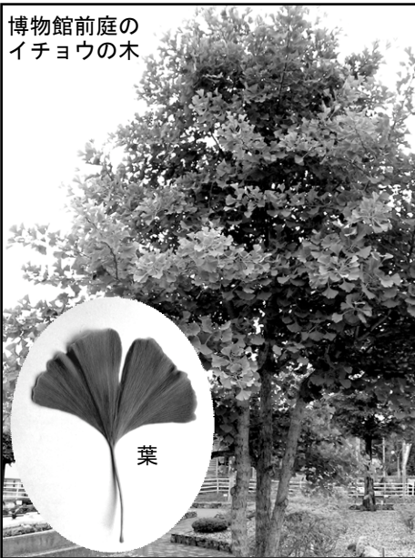
博物館前庭のイチョウの木

「生きている化石」と聞くと「シーラカンス」や「カブトガニ」植物では「メタセコイヤ」等を思い浮かべる方が多いと思いますが、日本ではお馴染みの「イチョウ」の木も実は「生きている化石」と呼ばれるもののひとつなのです。