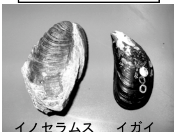
イノセラムス イガイ

白亜紀を代表する二枚貝、イノセラムスは、今も生きているイガイ（ムール貝）の仲間です。ムール貝は料理に使われますが、イノセラムスの化石にはかじられたあとが少ないので、あまりおいしくなかったのでは？と考える研究者もいます。