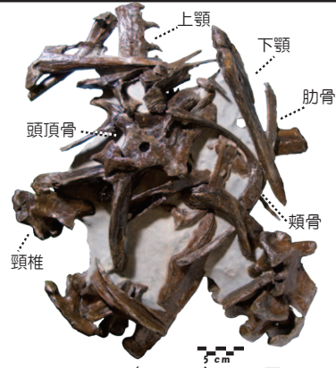
(2010年10月30日撮影) 2009年に発見された穂別博物館モササウルス第10標本（ホッピーだよりNo. 313、321も参照）