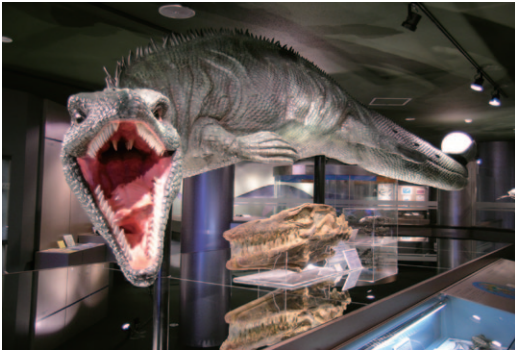
白亜紀海棲爬虫類モササウルス類の復元模型（穂別博物館）