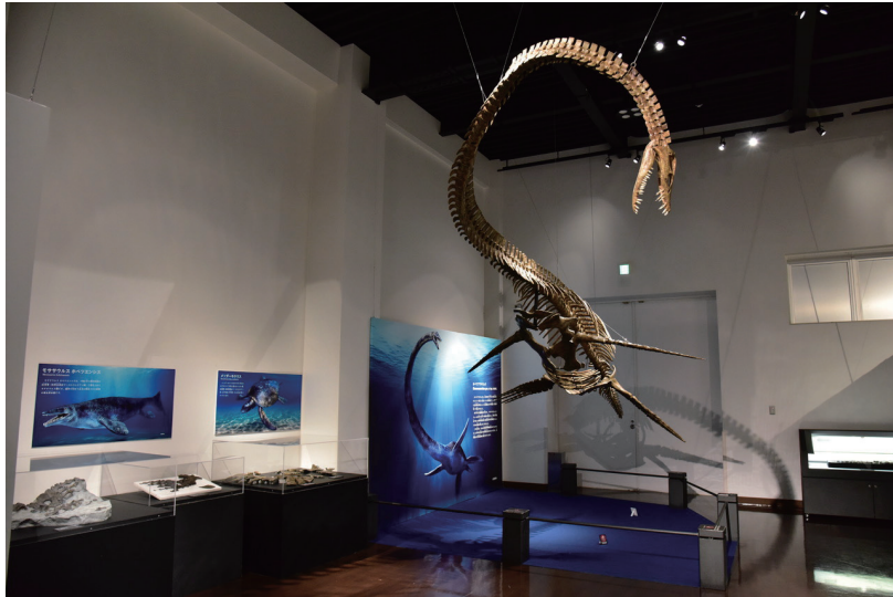
首長竜ホバツアラキリュウ全身復元骨格など

みふねまち きょうりゅう 御船町恐竜博物館の春期 特別展「太古の海の王者たち」 ( https://mifunemuseum.jp/2026/02/27/pmg/ )」で当館の首長竜ホバツアラキリュウ全身復元骨格(貸し出し用レプリカ)やモササウルス類などが展示されています。6月28日までご覧になることができます。