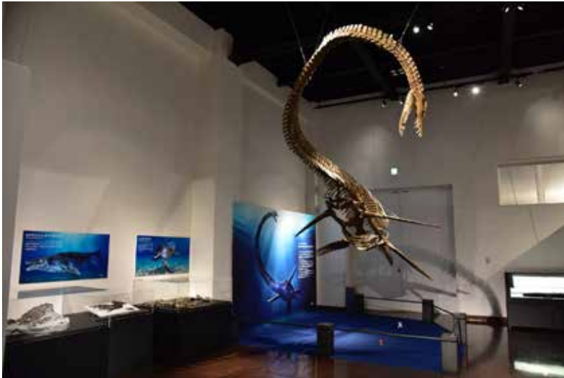
首長竜ホバツアラキリュウ全身復元骨格など

御船町恐竜博物館の春期特別展「太古の海の王者たち」(https://mifunemuseum.jp/2026/02/27/pmg/)で当館の首長竜ホバツアラキリュウ全身復元骨格(貸し出し用レプリカ)やモササウルス類などが展示されています。6月28日までご覧になることができます。