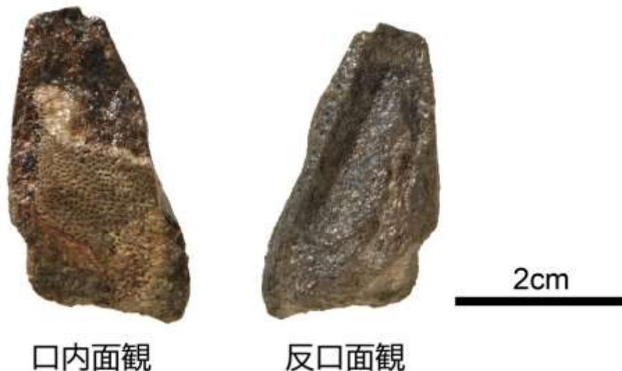
図1:ゾウギンザメの新種カロリンクス・オリエンタリスの口蓋骨歯板(左)。

2025年3月31日にむかわ町穂別博物館・北海道大学総合博物館などが取り組んだ「北海道の蝦夷層群上部白亜系函淵層から見つかったゾウギンザメ科魚類の新種カロリンクス・オリエンタリス」と題した研究論文が、日本古生物学会が出版している英文学術雑誌『Paleontological Research』から出版されました。