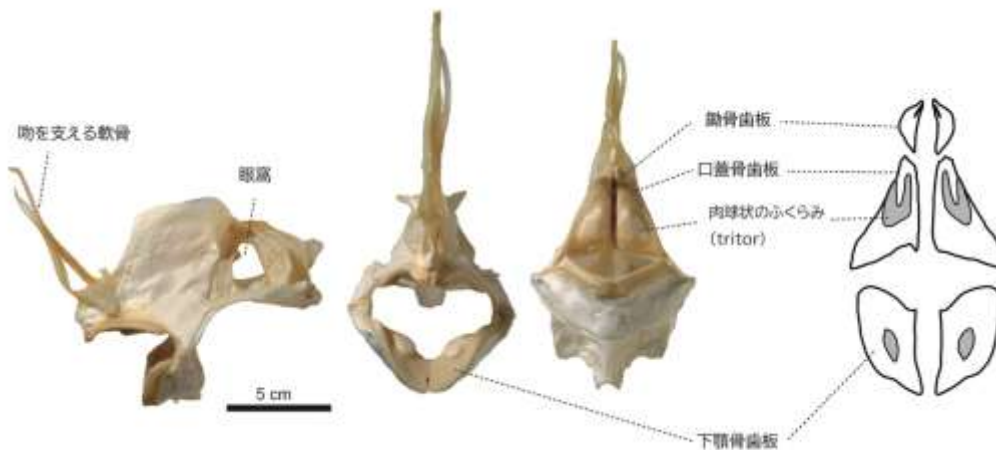
図 2:ギンザメ目カロリンクス属の(現生)頭骨と歯板の概要図(口内面観)。鋤骨歯板、口蓋骨歯板が上顎、下顎骨歯板が下顎に生えている。

現生のギンザメの仲間を含むギンザメ目魚類は歯板(tooth plate)と呼ばれる板状の歯を上顎に2対、下顎に1対、合わせて6つ持っています。サメやエイの歯と異なり、ギンザメの歯板は生え変わることなく生涯成長し続けます。歯板の咬合面には tritor と呼ばれる硬い組織でできたふくらみが存在し、種類によってその形状や個数が異なることから、化石種においては分類の指標とされています。