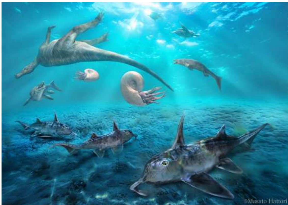
図 3:ゾウギンザメの新種カロリンクス・オリエンタリスの生態復元図と同時代の生物。 服部雅人氏提供。

HMG-2013 に見られるふくらみ(tritor)は後方部分が舌-唇側へと伸長しており、これは現生種・化石種を含めて既知のカロリンクス属の口蓋骨歯板には見られない形質です。この形質は歯板の摩耗しない部位に見られることから、摩耗などの影響を受けていない本来の形態を示しているものと考えられます。このことから、HMG-2013 はカロリンクス属の新種であるとして、カロリンクス・オリエンタリスと命名しました。オリエンタリスとはラテン語で「東の(もの)」を意味する形容詞であり、本種が北西太平洋地域=極東地域で報告された初めてのカロリンクス属であることにちなんでいます。