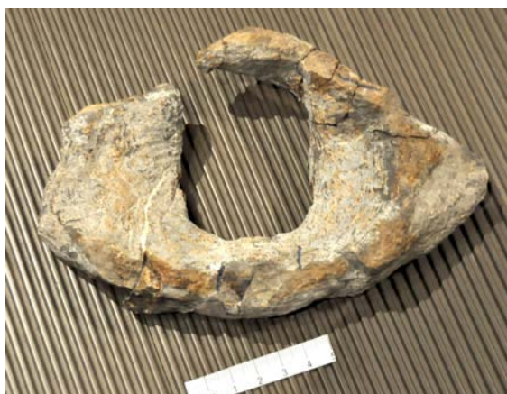
図3：研究に使用した標本の環椎。頭と関節する面がデコボコしていて、まだ骨が完全に固まっていないことから、大人になりきっていない若いヒゲクジラであると考えられます。