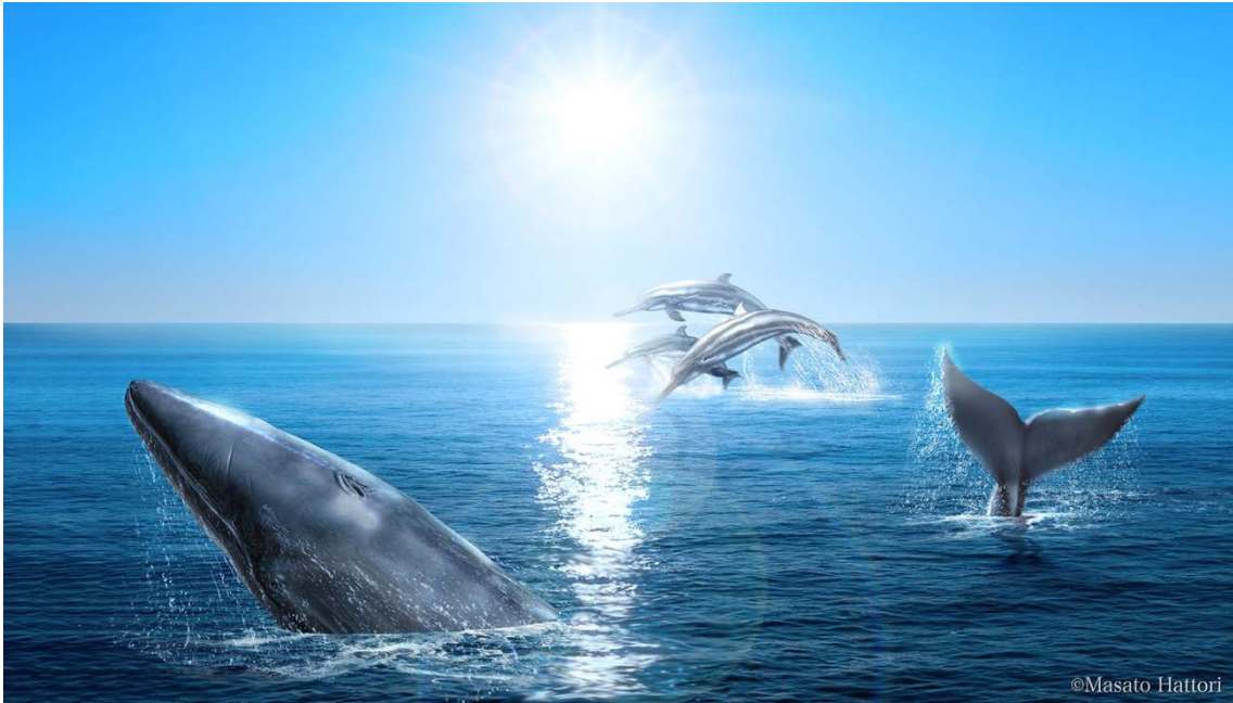
図5：ヒゲクジラとイルカが泳ぐ、およそ1600万年前の胆振・日高地方の様子。