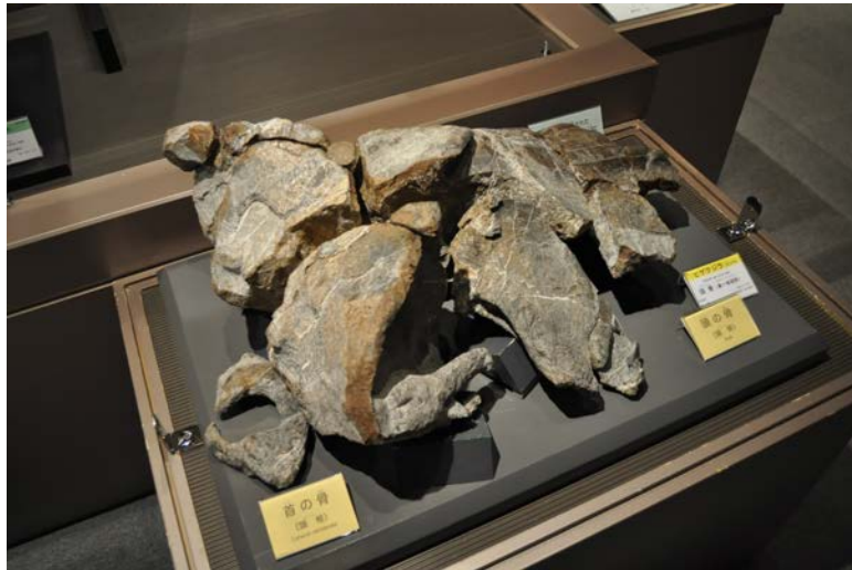
図2：研究に使用した標本は、8月9日からむかわ町穂別博物館の常設展示としてリニューアルして展示します（写真はかつての展示の様子）。