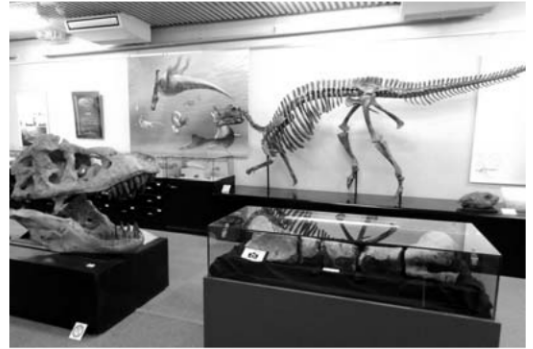
古生物の標本がたくさん展示されています!

7月26日にリニューアルを迎えた北海道大学総合博物館にて、むかわ恐竜の化石や新種モササウルスの標本を8月31日まで展示中です。無料で見学できますので、札幌方面にお出かけの際はぜひお立ち寄りください!