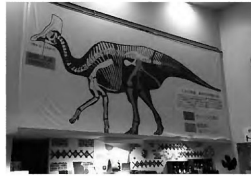
張り替えた新しい実物大シート

下から見上げるのも迫力がありますが、四季の館2階の図書館へと続く渡り廊下もオススメの見学スポットです。四季の館にお出かけの際は、ぜひ目線を上げてみてくださいね。