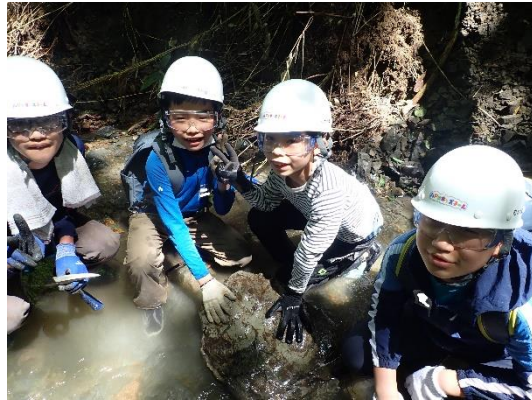
大型のイノセラムスを発見。