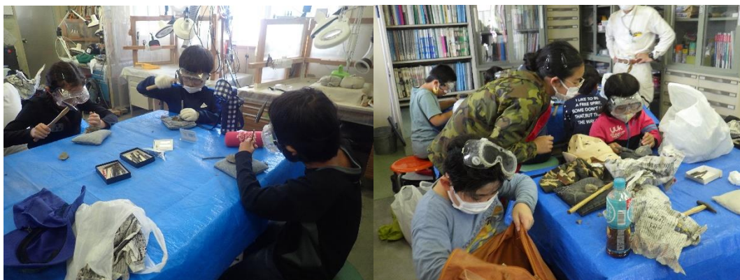
化石クリーニングの様子。右：卒業生ボランティア（中学生）による指導。

7月10日の活動では、卒業生ボランティア（中学生）3名、博物館ボランティア1名の方々にお手伝いをしていただきました。ご協力ありがとうございました。