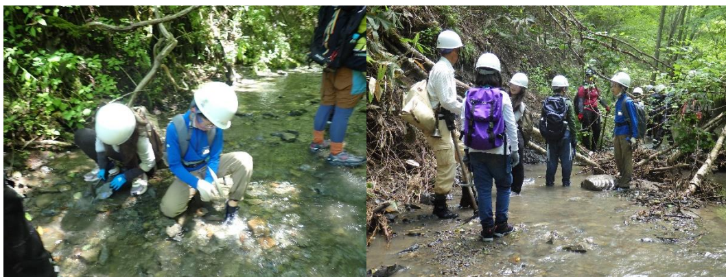
左右とも化石採集の様子。