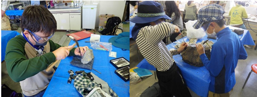
かせき学習館での化石クリーニングの様子