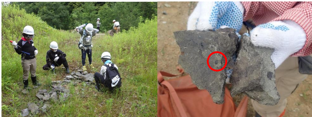
左：化石採集の様子。右：採集した二枚貝化石（赤丸で囲んだ部分）。