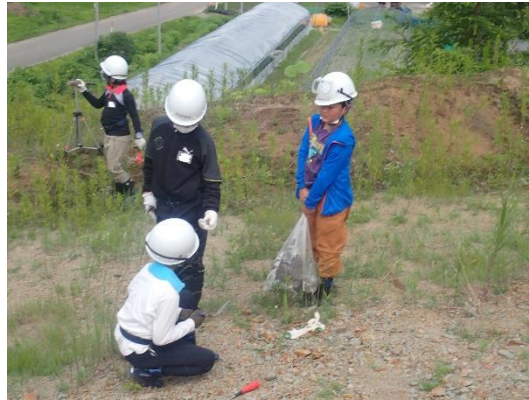
大量の化石を採集