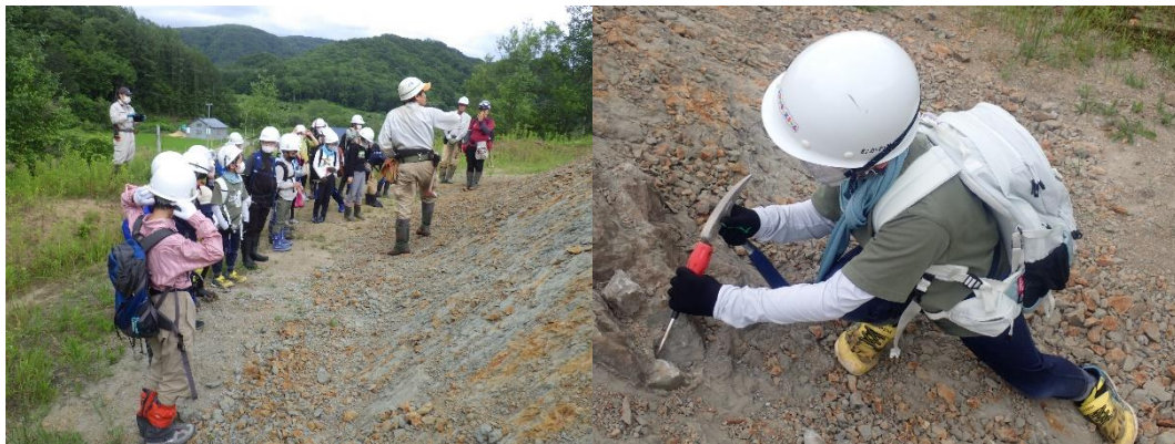
左：学芸員による説明。右：化石採集の様子。

18名の会員児童が参加しました。博物館に隣接するかせき学習館で装備をそろえてから、バスで学習用地へ行き、丘陵での化石採集を行いました。