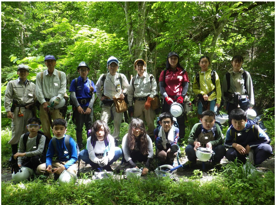
集合写真（前列：会員、後列：スタッフとボランティア）