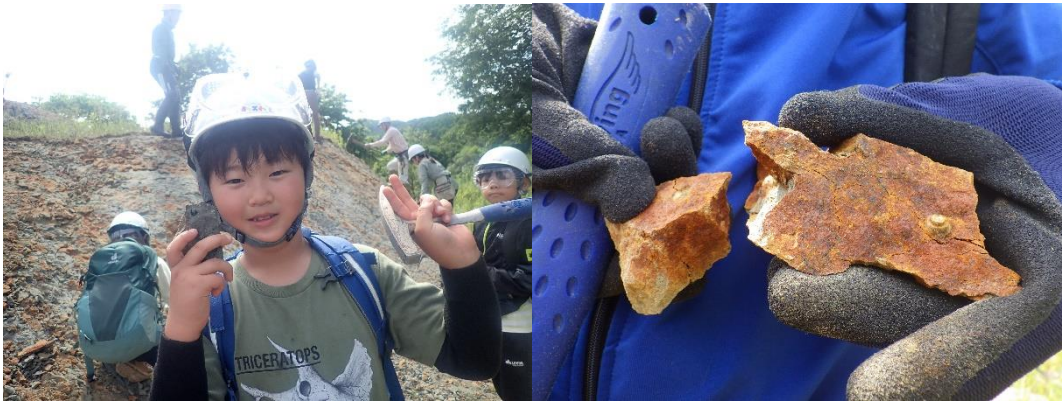
採集した化石。左：二枚貝化石。右：巻貝化石