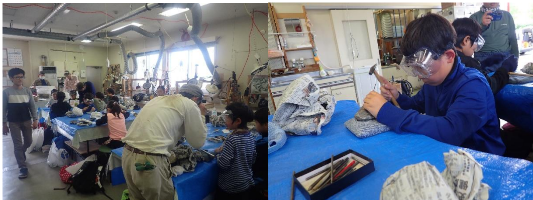
化石クリーニングの様子。

化石採集の時は晴れていて暑かったので（当日の午後は28℃まで気温が上がったそうです）、水分補給を行いながら採集を続けました。時折、風も吹いていたので、その時は快適に採集ができました。二枚貝や巻貝などの化石を全員が採集できました。その後かせき学習館に戻り、化石クリーニングをしました。