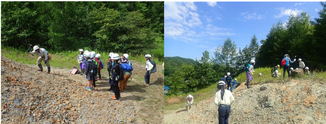
左：学芸員による説明。右：化石採集の様子。