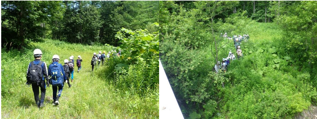
草むらを歩き、沢に向かいます。