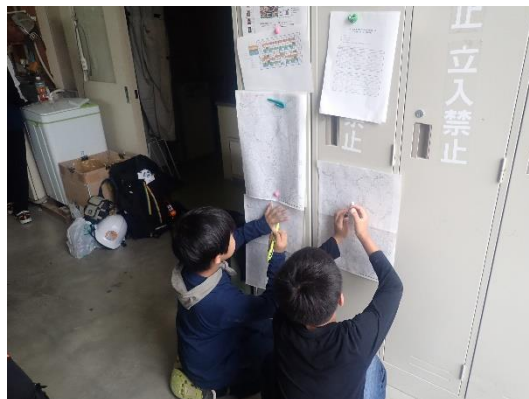
行った場所の確認・記録