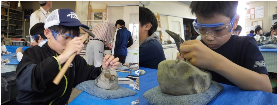
化石クリーニングの様子