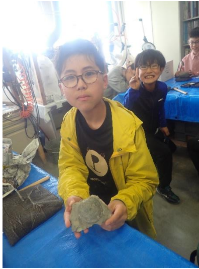
採集した二枚貝化石