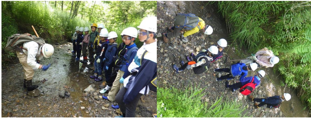
左：学芸員による化石の採り方などの説明。右：化石採集の様子。