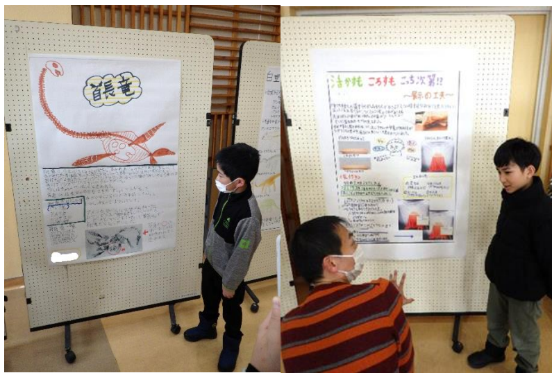
ポスター発表会の様子。

5・6年生の部と同様に、穂別博物館の1年間の活動紹介と化石クラブで学んだことのおさらいを行いました。