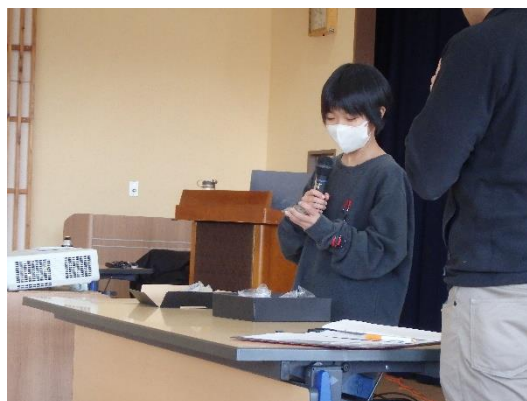
採集した化石などの発表（希望者のみ）。