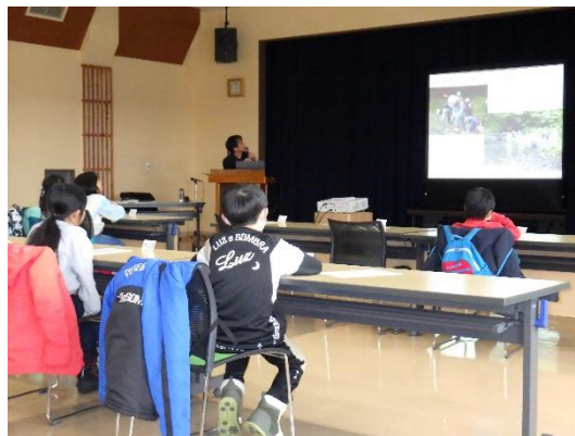
化石クラブで習ったことのおさらい。

5・6年生の部と同様に、穂別博物館の1年間の活動紹介と化石クラブで学んだことのおさらいを行いました。