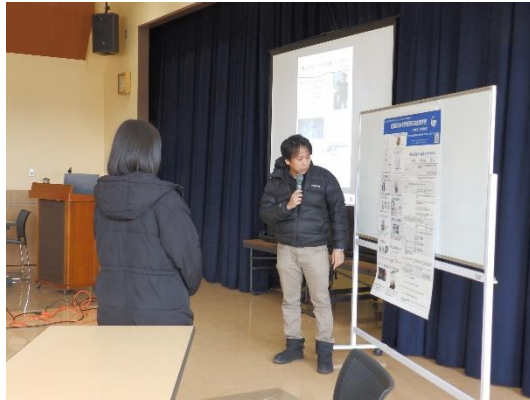
学芸員と中学生のボランティア（聴衆役）によるポスター発表の実演。