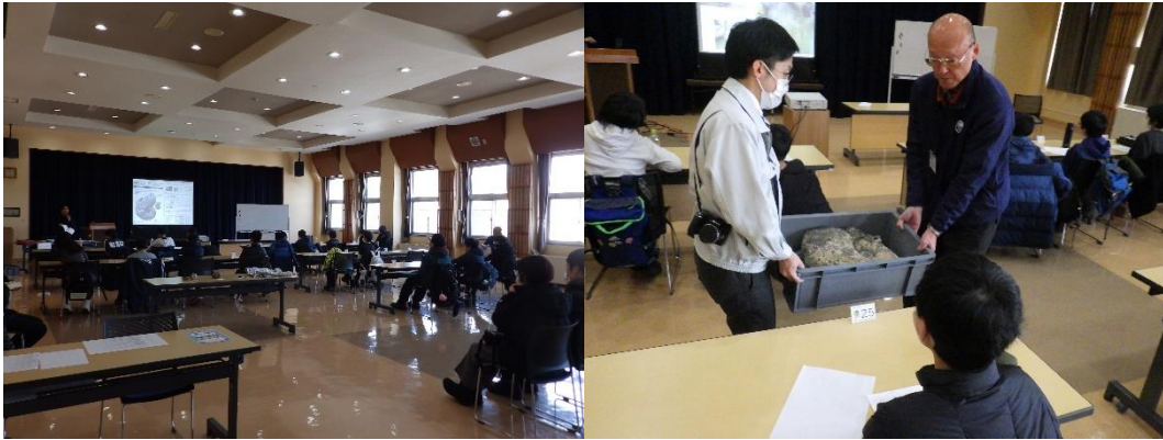
穂別博物館の活動紹介（左）。今年度採集した大型アンモナイトの中では小さく軽い標本（右）。

続いて穂別博物館の1年間の活動紹介を行いました。穂別博物館が携わった学术论文や採集した化石などについてスライドで紹介したほか、令和5年度に採集した大型アンモナイト6点のなかから1点を会場に持ち込み、会員児童たちに披露しました。最後に化石くらぶで学んだことのおさらいを行いました。