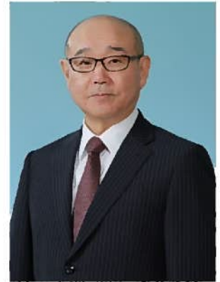
むかわ町長 竹中喜之

今後も町民の皆様と行政・議会が共に向き合い、一体となって、自治体運営をさらに高めつつ、復興に向けたまちづくりを進めてまいりたいと考えておりますので、町民の皆様のご理解とご協力をお願い申し上げます。