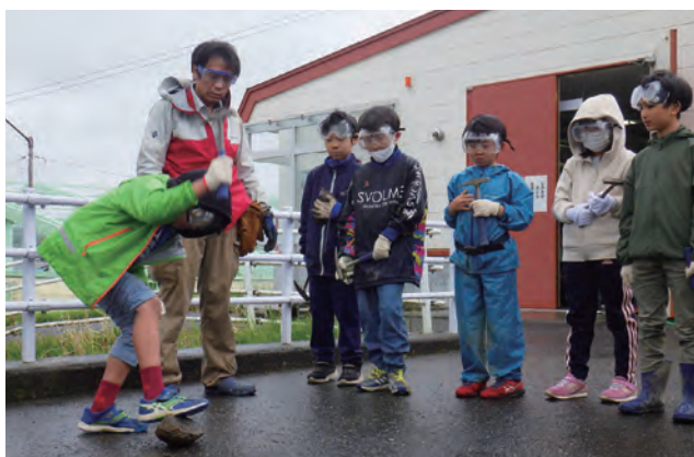
ノジュール割りに挑戦する3、4年生たち

すべての参加者は、自分で採集した化石や博物館が別途収集していた化石を使ってクリーニング体験を行いました。