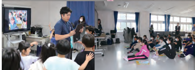
AR(拡張現実)浸水体験をする児童 同局職員の防災教室に参加する児童