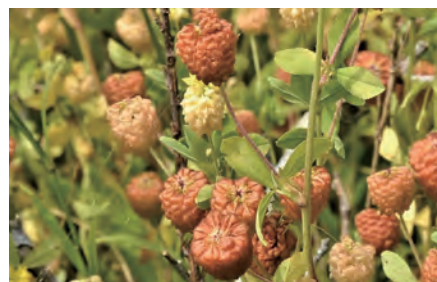
▶ テマリツメクサ の枯れ花 (汐見)