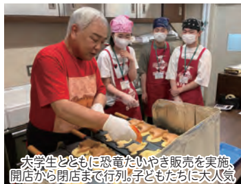
大学生とともに恐竜たいやき販売を実施、開店から閉店まで行列。子どもたちに大人気