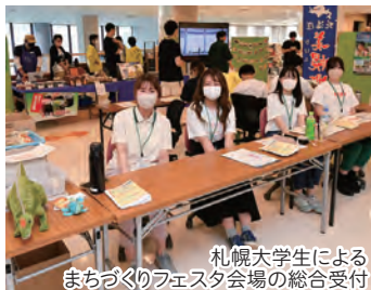
札幌大学生によるまちづくりフェスタ会場の総合受付