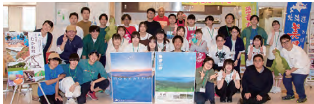
ご協力頂きました札幌大学生、むかわ町、美幌町の皆さん

むかわ町は令和4年3月に鶴川高校、札幌大学と三者で包括連携協定を締結しており、多くの大学生の協力を得て、恐竜たいやきや恐竜AR体験等を大学生とともに出店し、あわせて町のプロモーションを実施しました。会場にはファミリー層を中心に千人を超える来場があり、賑わいをみせました。