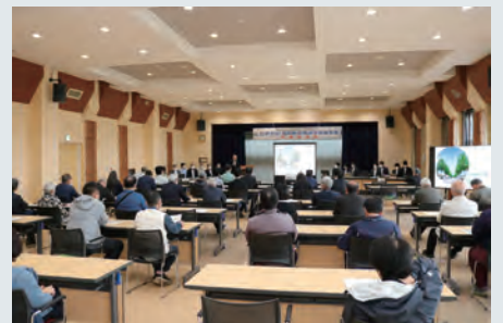
▲穂別地区町民説明会

基本設計の成果品概 要について、6月7日に 穂別地区、6月9日に鷗 川地区で町民説明会を 行いました。両地区合 せて84名の方にご出席 いただきました。 参加者の方からは、整 備した施設を有効に活 用していくためのソフ ト事業について検討し てほしい等の意見を多 くいただきました。今後 も、広報等で情報提供を 行ってまいります。