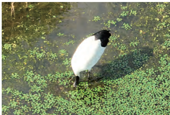
水の中でヒナの餌を探すメス親 (2023年7月3日撮影)