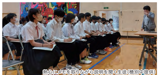
熱心にメモを取りながら説明を聞く生徒

会場に各校ブースを設け、学校の特色や教育活動などを紹介しました。生徒たちは、事前に選択した興味や関心のあるブースに移動し、メモを取りながら各校の説明を真剣に聞いていました。また、説明会後には、進路担当者へ積極的に質問をする生徒の姿が見られました。