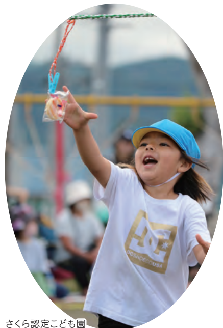
さくら認定こども園

また、親子や世代別競技が行われ、園児や保護者、卒園生が協力しゴールを目指していました。