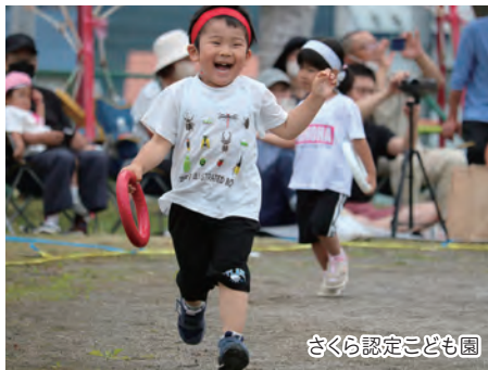
さくら認定こども園