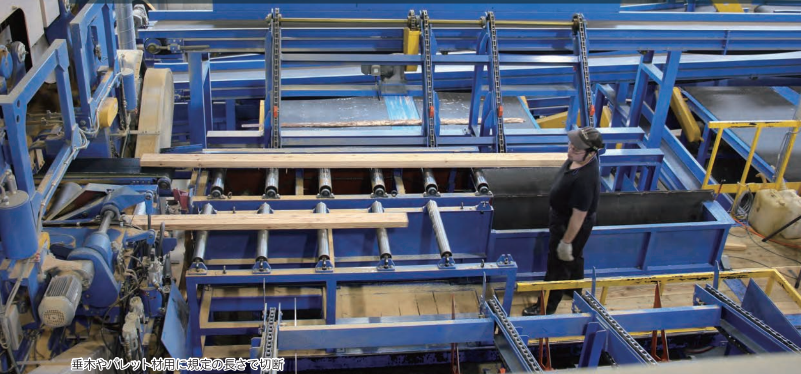
垂木やパレット材用に規定の長さで切断