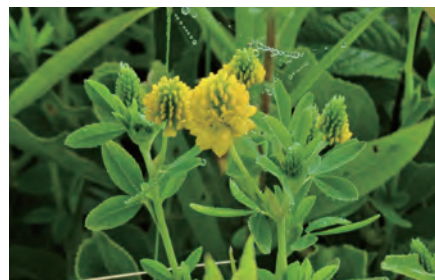
◀ 6月頃の テマリツメクサ (汐見)

【問い合わせ先】生涯学習課 社会教育グループ 田代学芸員/社会教育士 ☎42-2487