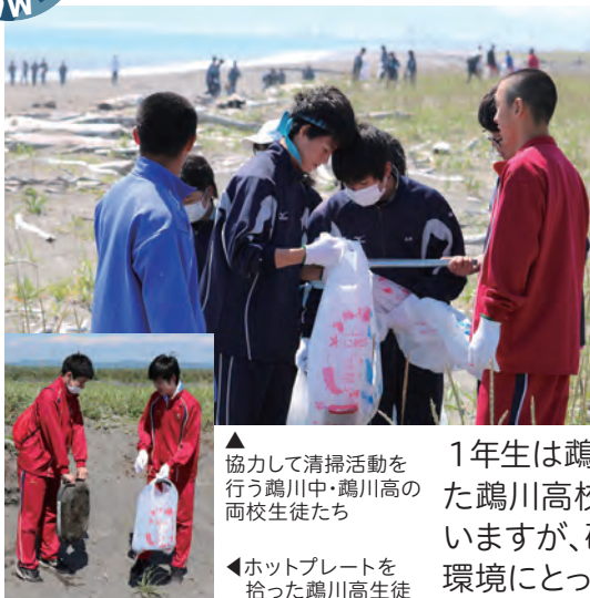
▲協力して清掃活動を行う鷗川中・鷗川高の両校生徒たち