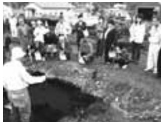
担当者の説明に真剣に耳を傾ける参加者たち

穂別博物館主催の「穂別D遺跡見学会」が7月13日に開かれ町民約20人が参加しました。この見学会は、北海道立埋蔵文化財センターの協力により行われたもので、担当者が出土した土器や石斧、道内各地の遺跡との類似点などを実物やパネルを使い説明。その後、発掘現場に出向き実際に発掘している様子や、出土品がどのような状態で発見されたかの説明を受け、参加者たちは発掘調査について熱心に質問していました。今後の調査で大きな話題が発掘されるといいですね。