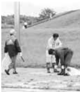
↑ししやもパーク内のごみを拾う参加者

7月13日、鵜川河川敷地の清掃活動(おかわ町一級河川鵜川愛護協議会・苫小牧河川事務所共催)が多くの町民の方々の善意で行われました。