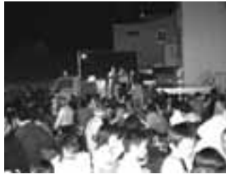
大抽選会で盛り上がる会場の様子

最高気温が28℃まで上昇したビール日和のこの日、穂別町商工会青年部主催のビール祭が催され多くの人で賑わいました。このビール祭は穂別地区の商工業者が協賛して行われているもので、今年で4回目を迎え、毎回多くの景品が用意されることから人気も上々。出店では焼肉、焼鳥、しゃも、わたあめなどを多くの人買い求め、友達や家族と楽しいひと時を過ごしていました。3回にわたって行われた大抽選会では、番号が発表される度に大きな歓声が沸き起こっていました。