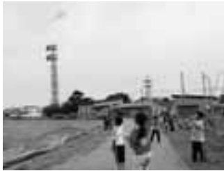
6月26日に行われたクラブ活動「凧づくり」

鵜川中央小学校で今年度からスタートした、地域の方々を先生とするクラブ活動が6月5日から始まりました。4月に地域で特技を持つ先生を募集したところ、ペーパークラフトや凧作り、パタンク、ゲートボールなど8分野の先生がボランティアとして集まりました。6月26日には、2回目のクラブ活動が行われ、児童たちはユニークなクラブ活動の体験に目を輝かせていました。活動は計10回予定しており、最終日となる10月2日には、クラブ発表会を予定しています。