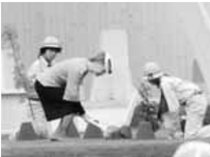
↑皇后陛下によるお手植え