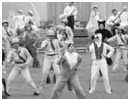
↑未来からの森のメッセージ