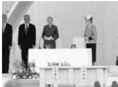
↑天皇陛下のお言葉