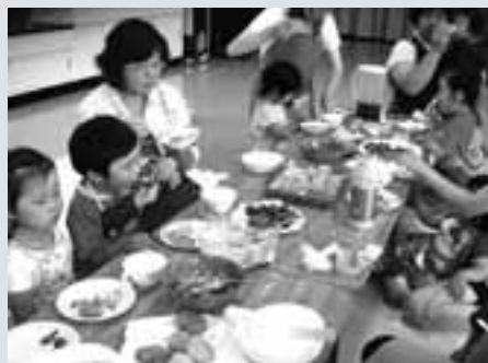
↑おひさま広場に集う親子で、ほうれん草やブロッコリーを使う料理をしました。小さいながら、興味のあること、自分でできることには積極的です。

今、冷蔵庫には何を冷やしていますか？子どもの体は大人よりも水分割合が多いので、大人の2倍の水分補給が必要です。冷蔵庫に糖分の多い清涼飲料水が常備されると、摂取した糖分の消化のためにビタミンB1が消費されて疲れやすくなります。糖分の摂取で、食欲も低下することが多いので1日に飲む量を決めるなど、注意してください。毎日できるこんな事も「食育」です。