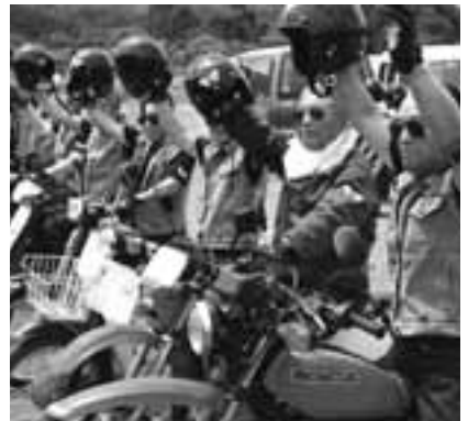
↑バイクにまたがり準備万端の爺いライダー