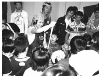
チーズの伸びの良さに大満足!子どももビックリ!

小学生を対象とした「ふれあい農業体験」(JAむかわ青年部主催)が小学生と保護者ら49人が参加し、四季の館や現地で開催されました。前日から早朝にかけての降雨のため、カボチャの収穫体験はできませんでしたが、カボチャの由来・種類等について学びました。JAの共同施設で野菜の選別から箱詰めを見学、夕見家畜牧場での大型トラクター試乗では、恐る恐る運転を体験、毛利牧場では牛舎見学と搾りたての美味しい牛乳を試飲、四季の館ではさけるチーズ作りに挑戦!と盛りだくさんの内容に子どもたちは満足そうでした。