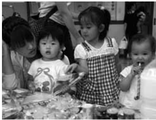
お店の前でいろいろなモチャを選ぶ子どもたち

穂別福祉児童館内(きらり)を会場に乳幼児とその保護者を対象に「おひさま広場」の夏まつりが開催されました。おひさま広場は乳幼児を持つ親が子どもと一緒に集って交流する子育て支援事業です。会場には乳幼児とその保護者ら約62人が参加。職員やボランティアの方が企画したヨーヨーつりや、くじびきなどの店が立ち並び、親子でお店を巡ったりゲームを楽しんだり子ども達はしゃぐ声でいっぱいになりました。穂別おひさま広場では様々な講座を予定しています。ぜひおひさまと一緒に参加してみたいかが。