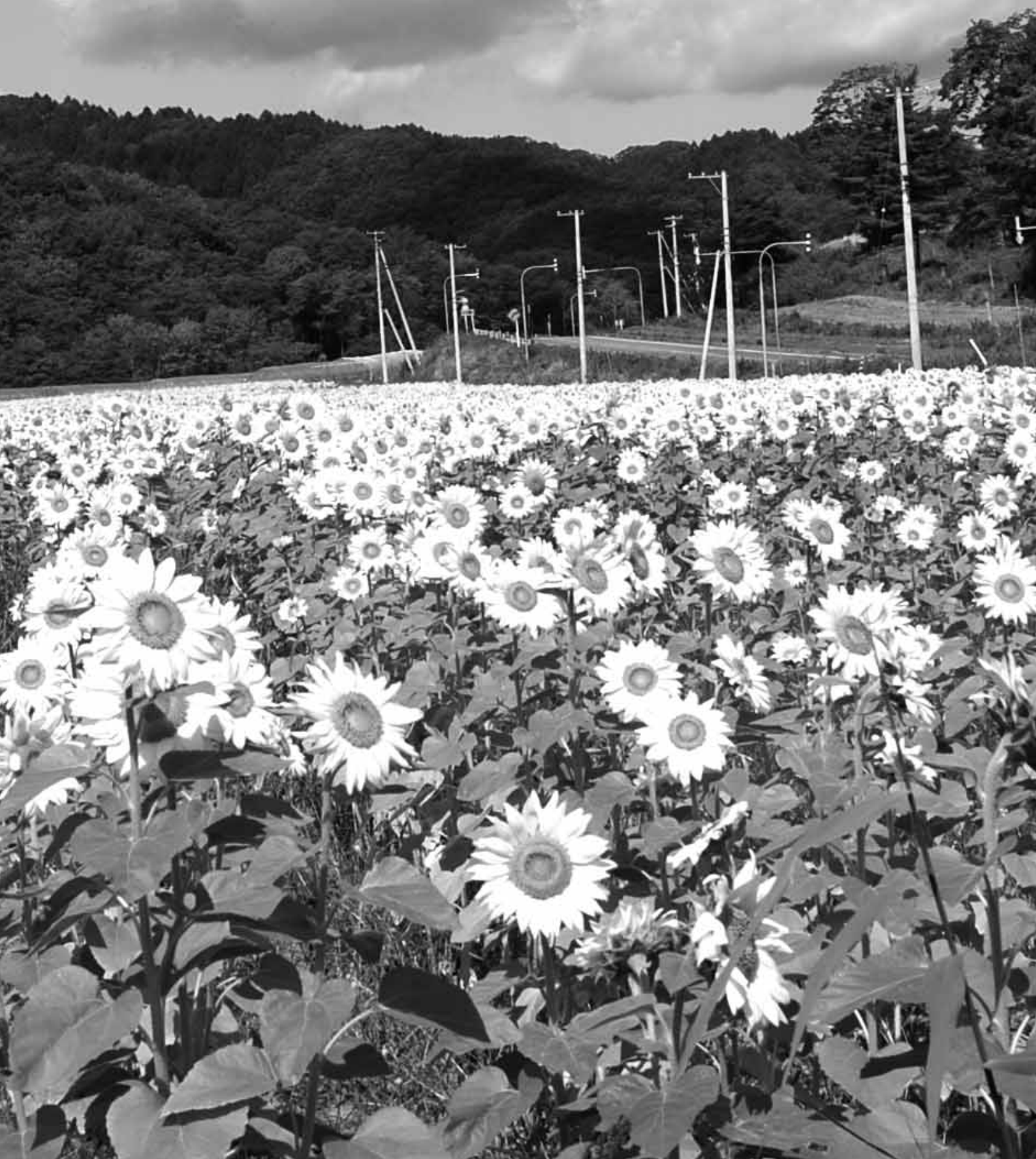
写真/ 9月11日撮影 星博司さん(穂別栄)方の畑に2万本のヒマワリ満開