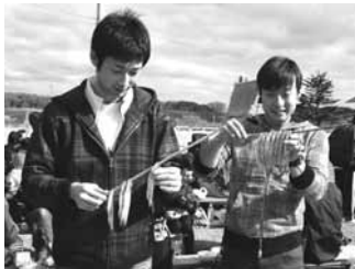
ヨシの茎でししゃもを刺す体験を楽しむ来場者

鵠川と“ししゃも”の歴史と文化、生態・加工・流通・飲食について五感で感じ多くのことを知ってもらおうと「鵠川柳葉魚浜まつり」(町内の官民7団体でつくるむかわ町田園教育力再生協議会主催)が、JR夕見駅前広場で行われました。「食」だけではなく「観る・聴く・体験する」コーナーを設け、パネル展、ビデオ上映、即興寸劇「柳葉魚伝説」・民謡「柳葉魚舟唄」の披露・すだれ干しししゃもの目刺し体験等々盛りだくさんの内容。地元近隣はもとより札幌、稚内等遠方から約1,300人が訪れ、柳葉魚づくめの1日を楽しんでいました。