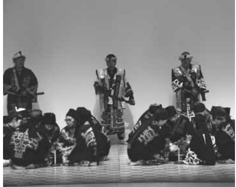
↑鶴川アイヌ文化伝承保存会の「うぼぼ(座り歌)披露