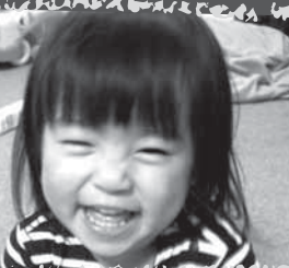
越善ののは (H19・12・11生)

我が家のムードメー カー! いつまでも 笑顔がステキな のんちゃんできてね。 パパ、ママより