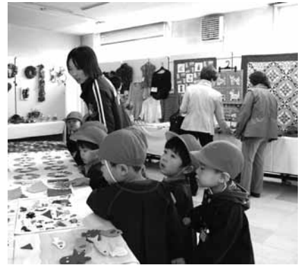
↑穂別地区の展示会場に多くの来場者が訪れ鑑賞