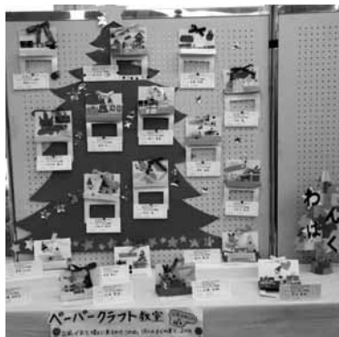
↑鶴川地区「わんぱく」での子供たちの力作