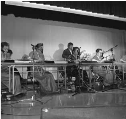
↑大正琴を奏でる穂別地区琴紫会の皆さん