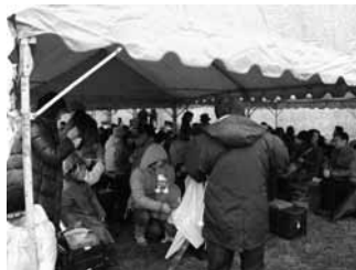
用意されたテントの中でししゃもを堪能する来場者

今が旬の本場ししゃもを味わってもらおうと今年も「ししゃもあれとぴあinむかわ」(実行委員会主催)が役場本庁舎北側の広場で開かれました。雨と風が冷たい悪天候にもかかわらず、観光バスが乗り付けるなど町内外からたくさんの方が訪れ、開始前から「ししゃも寿司」「ししゃも汁」などを買い求める人で長蛇の列が出来ました。テントの中は家族連れなどで賑わい、炭火で焼いたししゃもや、温かい「ししゃも汁」の美味しさに満足げな笑顔が見られ、午後からは雨もあがり最後まで賑わっていました。