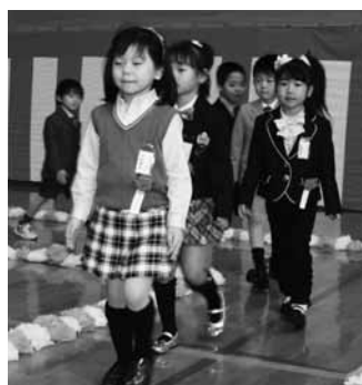
4/5徳別小学校 入場行進は緊張気味