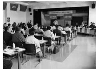
協議会終了後は、注意旗の配布も行われました

＊危険期間 4月1日～6月30日 ＊林野火災予防強調期間 4月10日～5月31日