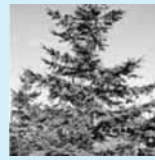
【町の木】 アカエゾマツ