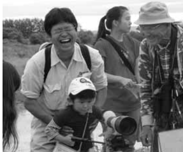
干潟は楽しいこといっぱいあるよ (写真は今年の干潟観察会)