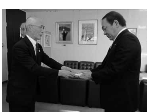
平成24年に引き続き白米1トンが寄贈されました。