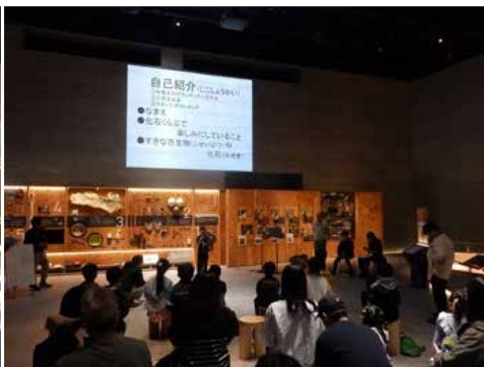
4月19日のむかわ町子ども化石くらぶ

臨時休館中の4月5日および12日にむかわ町民対象の内覧会を開催し、計900名以上の町民の方々に恐竜館などの展示をご覧いただきました。4月19日には、今回だけの特別開催として、「むかわ町子ども化石くらぶ第1回」のガイダンスを恐竜館で開催しました。