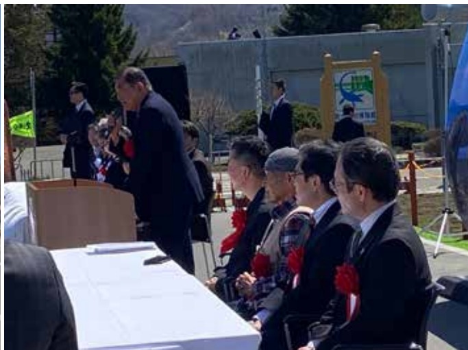
石破 前総理大臣による祝辞