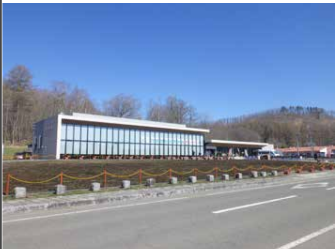
リニューアルオープン当日（4/25）の恐竜館