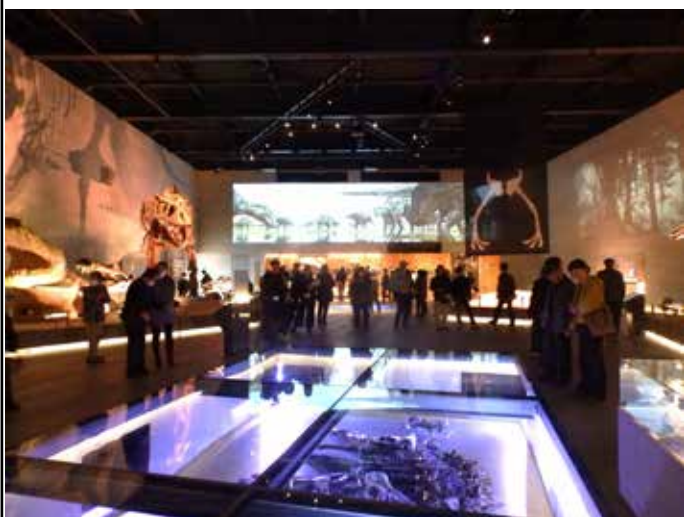
4月5日の町民無料内覧会