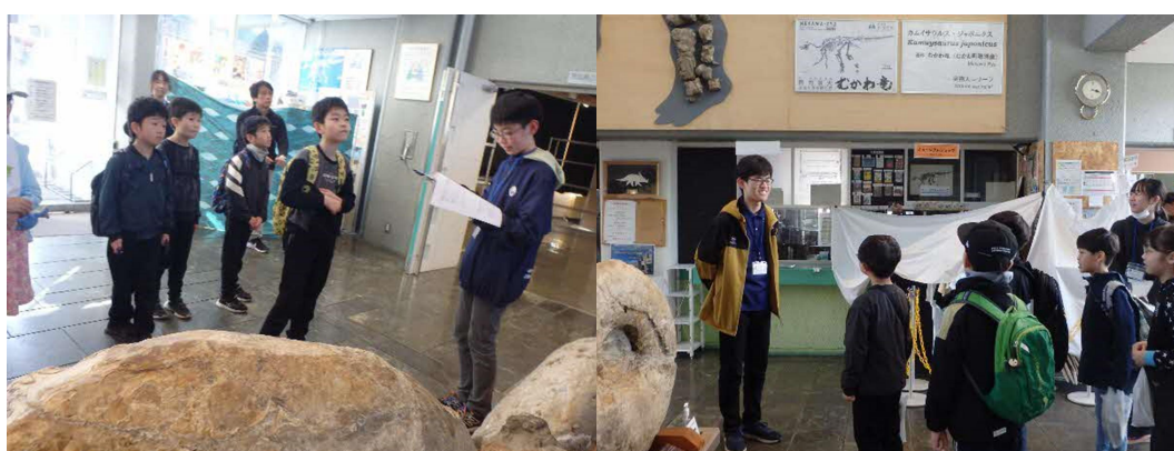
中高生のボランティアによる展示案内