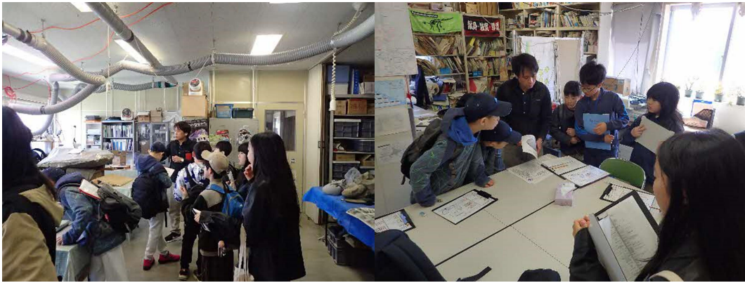
作業場及び学芸員部屋の見学。

12:00の解散後、13:00まで恐竜館の自由見学時間としました。午後からの3・4年生もこの時間に恐竜館の自由見学としました。