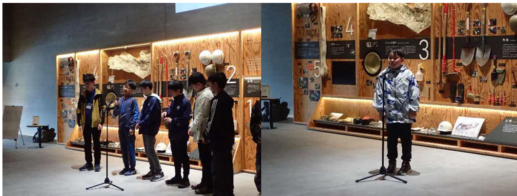
中高生のボランティアによる自己紹介の見本（左）。会員児童の自己紹介（右）。