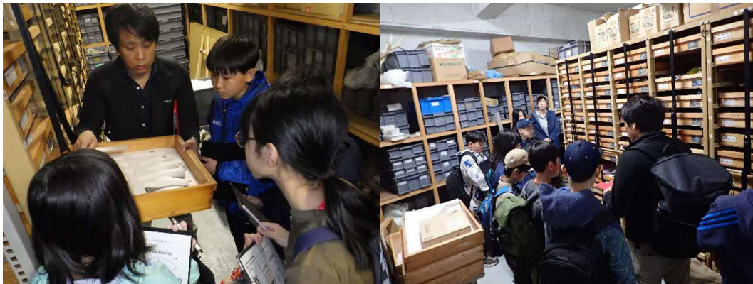
博物館（海洋化石館）収蔵庫の見学。クビナガリュウのホベツアラキリュウ骨化石を観察しているところ（左）。