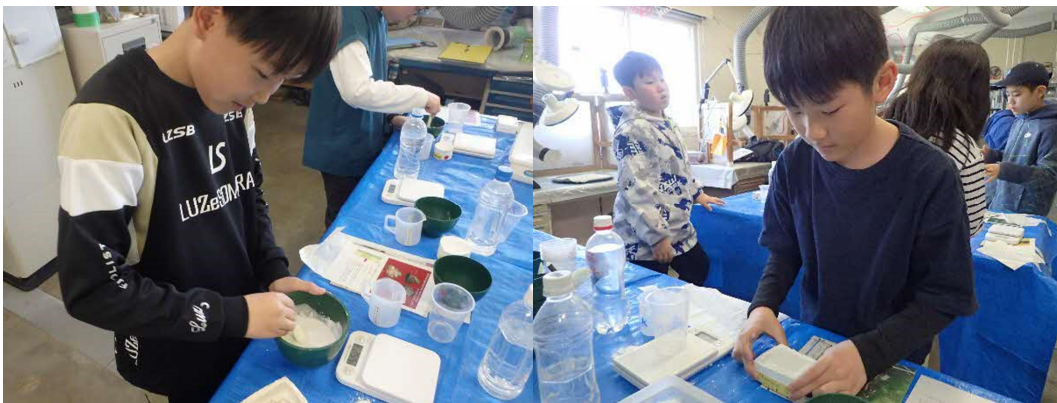
化石レプリカづくり