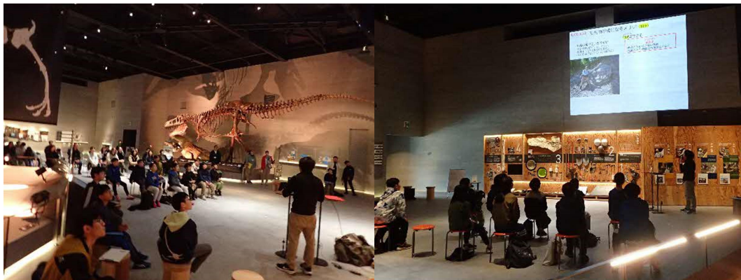
学芸員による子ども化石クラブの説明

恐竜館でのオリエンテーション後、5年生と6年生の2グループに分けて、かせき学習館での化石レプリカ製作（石こう模型の製作）と海洋化石館展示室と博物館バックヤードの見学を行いました。バックヤード見学では、普段は入れない学芸員部屋や収蔵庫の見学を行いました。