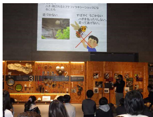
学芸員による子ども化石くらぶの説明

恐竜館でのオリエンテーションの後、会員児童を3年生と4年生に分け、かせき学習館での化石レプリカ製作（石こう模型の製作）と海洋化石館の見学・展示案内をそれぞれ行いました。海洋化石館の展示案内は中高生ボランティアの方々に行っていただきました。