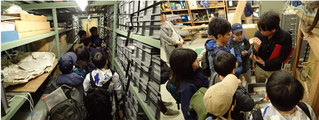
博物館収蔵庫の見学。カムイサウルスの骨化石を観察しているところ（右）。