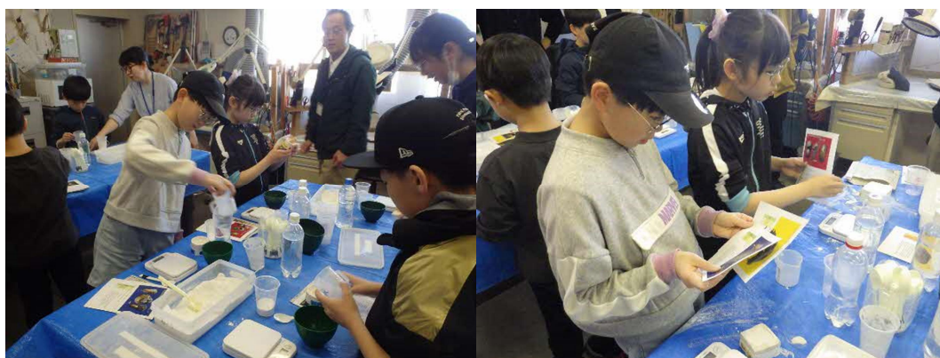
化石レプリカづくり