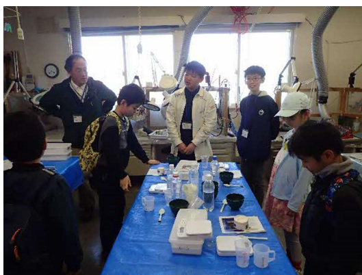
中高生のボランティアによるレプリカづくり指導