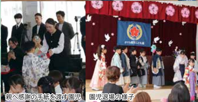
親へ感謝の手紙を渡す園児