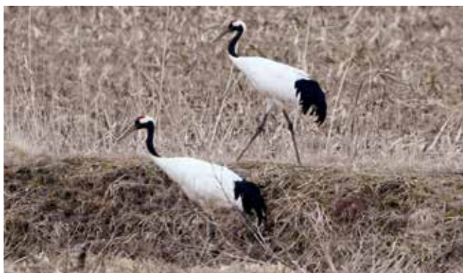
むかわペア(むかわ町、2026年3月下旬)

環境省が2026年3月に公表した「第5次レッドリスト」において、タンチョウはこれまでの“絶滅危惧Ⅱ類”から外れ、“準絶滅危惧”に分類されました。これは、3歳以上のタンチョウが推定で1,200羽を超えるまでに回復し、長期的に増加傾向が続いていると評価されたためです。1900年代初頭には絶滅の危機に直面していたタンチョウですが、給餌活動、生息地の保全、電線衝突防止など、多くの関係者による継続的な取り組みにより、羽数は着実に増えてきました。現在では、道東を中心に道央や道北にも分布が広がったこともカテゴリー変更の根拠となっています。一方で、“準絶滅危惧”は将来的な環境変化によって再び絶滅の危険性が高まる可能性があるカテゴリーです。今後も湿原の保全や人との共存に向けた対策を継続し、安定した生息環境を守っていくことが重要となります。