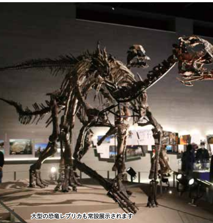
大型の恐竜レプリカも常設展示されます

この日は家族連れなど約500人の町民が訪れ、北海道で初となる「恐竜博物館」の迫力ある展示をいち早く体験しました。