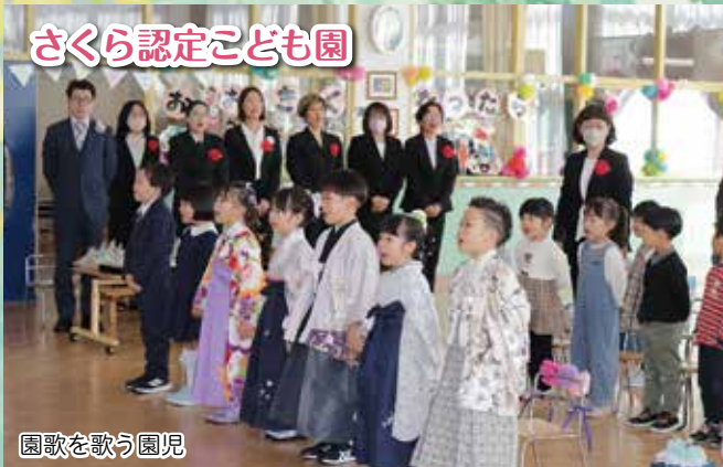
さくら認定こども園

3月14日にさくら認定こども園、3月15日にひかり認定こども園で卒園式が行われました。 さくら認定こども園は13名、ひかり認定こども園は20名の卒園する園児が出席し、 保護者やお世話になった先生に見守られながら、巣立ちの日を迎えました。