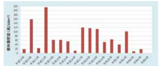
図1 鵠川河口周辺海域における稚魚の採捕数(100㎡当たりの尾数)