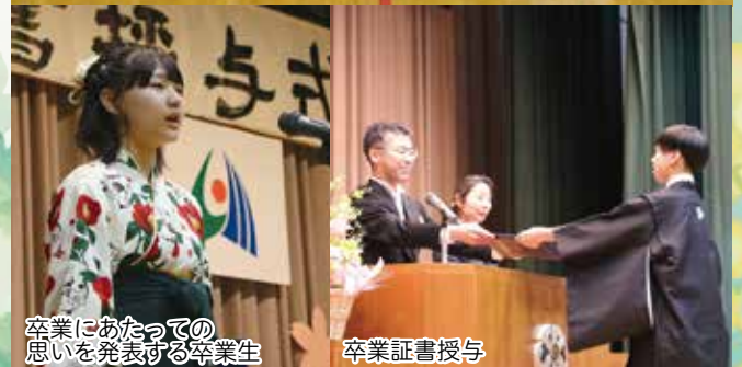
卒業にあたっての 思いを発表する卒業生