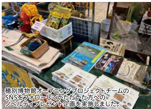
穂別博物館オープニングプロジェクトチームのSNSをフォローしていただいた方へのノベルティプレゼント企画を実施しました。