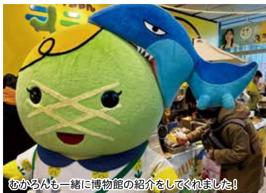
むかるんも一緒に博物館の紹介をしてくれました!