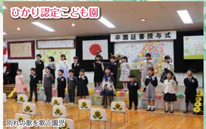
ひかり認定こども園