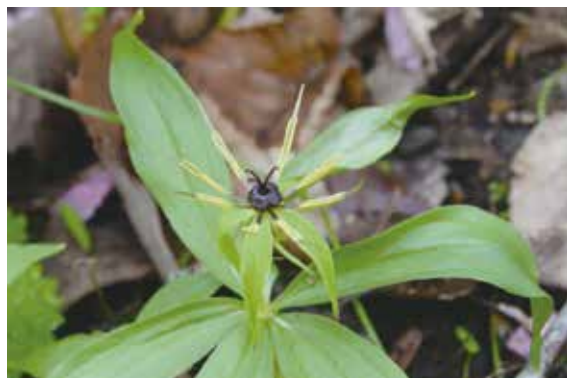
クルマバツクバネソウ(有明)