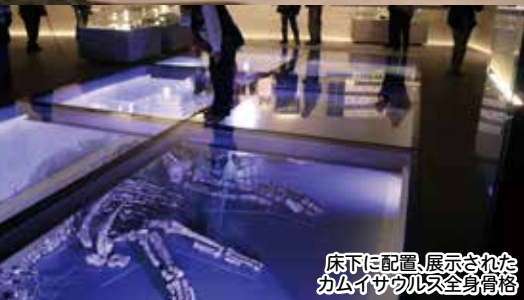
床下に配置、展示されたカムイサウルス全身骨格