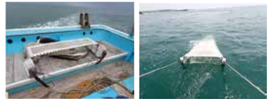
写真1 シシャモ稚魚採捕用ソリネット

今後は、休漁等の資源保護に伴う効果や生息域となる沿岸環境保全に、各調査結果を役立てたいと考えております。