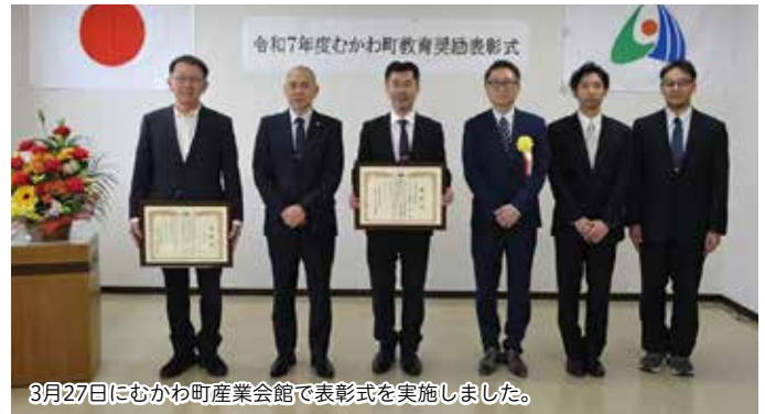
3月27日にむかわ町産業会館で表彰式を実施しました。