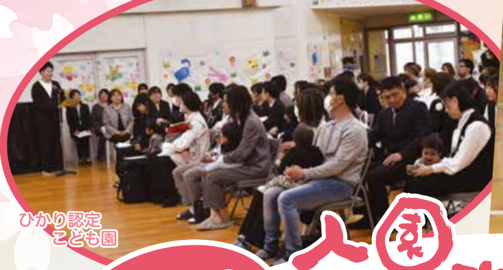
ひかり認定 こども園