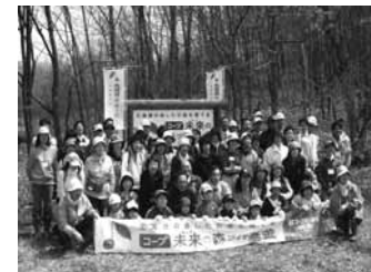
植樹祭に参加された皆さんで記念撮影

「ほっかいどう企業の森林づくり」事業で今年3月19日、胆振支庁長立ち会いにより「生活協同組合コープさっぽろ」と「むかわ町」の協定が結ばれていましたが、この度1年目の取組として植樹祭(生活協同組合コープさっぽろ苫小牧地区本部主催)が開催されました。この事業は、むかわ町所有の山林1.2%にカラマツ480本を5年間に渡り毎年植栽し、その後4年間下草刈り等の保育活動も行われます。この日は、午前中約80名の一般参加者やスタッフの手でカラマツ500本を植樹し、午後からは松ぼっくり、小枝などを使ってコースターや写真立てなどの木工品作りを楽しんでいました。