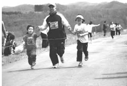
↑仲良く手をつないで最後まで