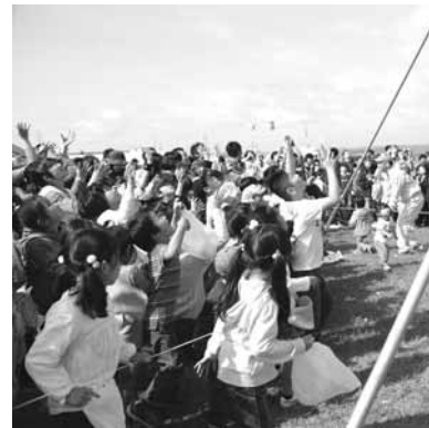
↑お菓子まきに子どもたちは大喜び。