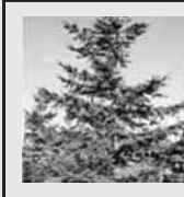
【町の木】 アカエゾマツ