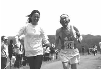
↑有森さんに励まされゴールを目指す