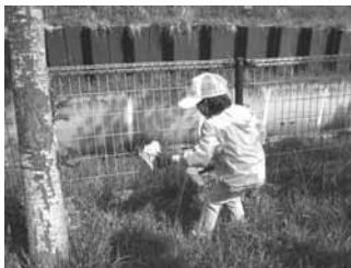
子どもも一生懸命ゴミ拾いをしてくれました

好天に恵まれた日曜日。環境への関心をもっと広げようと「空き缶等散乱防止キャンペーン」が行われ、わんぱく(青少年対象事業)・高齢者大学課外講座の対象者や一般住民の方々約70名が参加。3班に分かれ市街中心部、小学校方面、中学校方面へ向かって袋と火ばさみを持ち、約1時間かけて町内のゴミを拾い集めました。「町をきれいにして気持ちよく過ごしたいから」など理由は様々ですが、親子で参加したお母さんは「子どもにどこへでもゴミを捨てないことを教えるために」と話してくれました。燃えないごみコンテナ10個、燃えるごみ20袋が集められました。